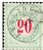
SBK 19AII/K Zeglingen 138/218 Güller 449