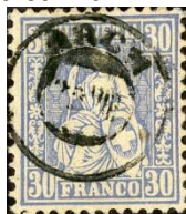
SBK41 Arch 140/1