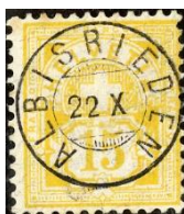
SBK 63A et 67Aa Albisrieden 138/4 Güller 749