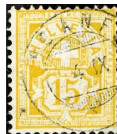
SBK 63A Scans 139/12 Güller 163