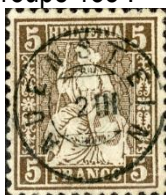
SBK 30 Auenstein 138/14 Güller 893