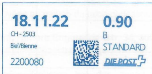
Figure 1. Nouvelle empreinte IFS3 avec indicatif 22 .

Depuis quelque temps, on voit apparaître des EMA avec l'indicatif 22 (voir figure 1).