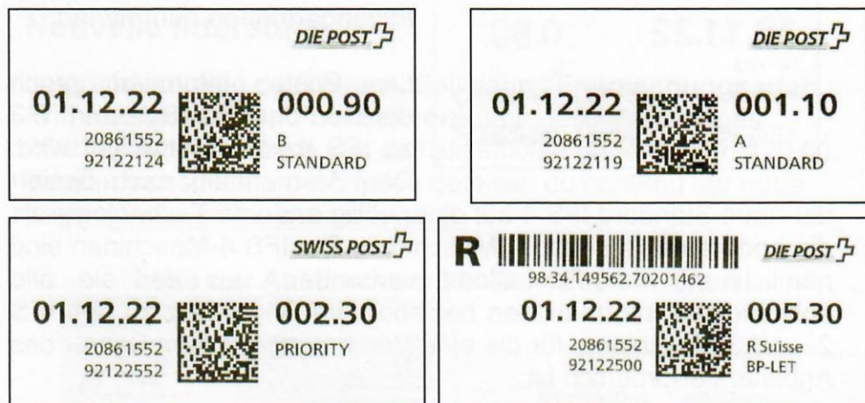
Figure 2. Exemples de layout pour l'IFS4.

Le layout (figure 2) reprend les spécifications standards IFS dans les grandes lignes (positionnement de la solution), avec toutefois quelques adaptations.