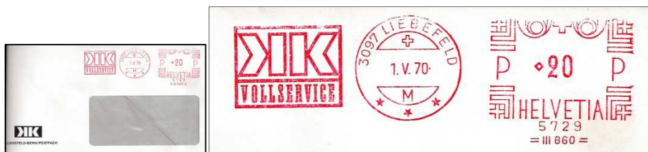
Figure 2. EMA de type 3A (Hasler F88) avec un carré en guise de 1 er chiffre pour la valeur.

Aussi, je trouve intéressant de montrer aux collectionneurs, qu'il est toujours possible de découvrir des documents intéressants et peu courants, puisque la figure 2 illustre un pli trouvé récemment dans une boîte en carton avec d'autres EMA. On constate qu'il s'agit de la même machine n° 5729.